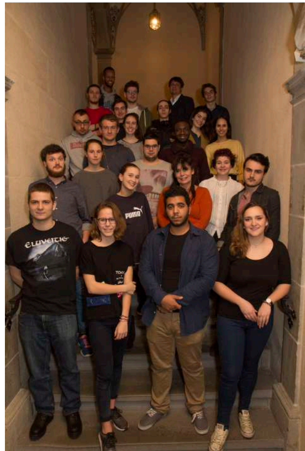
Des Membres du CdJL à l'Hôtel de Ville.